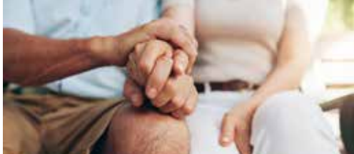
Mantelzorg: meer dan alleen een premie p. 2