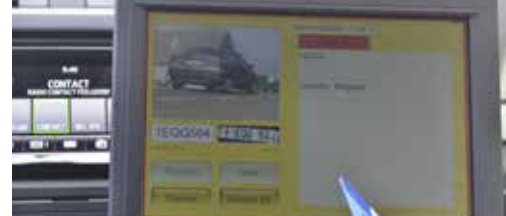
Investeren in veiligheid p. 3