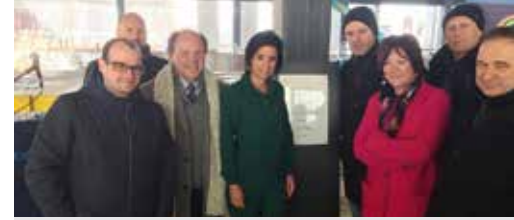
Eerstesteenlegging nieuw zwembad (p. 3)